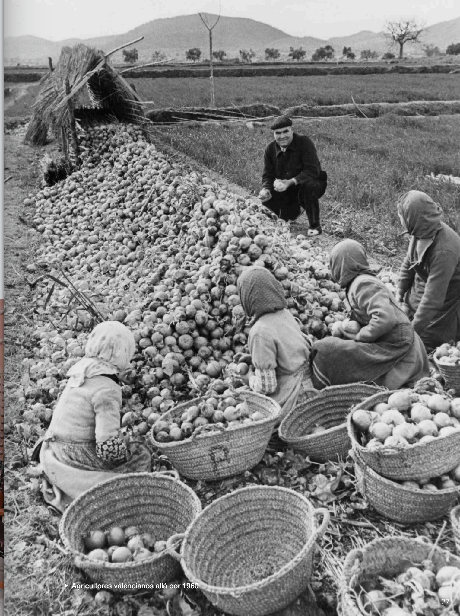
► Agricultores valencianos allá por 1960