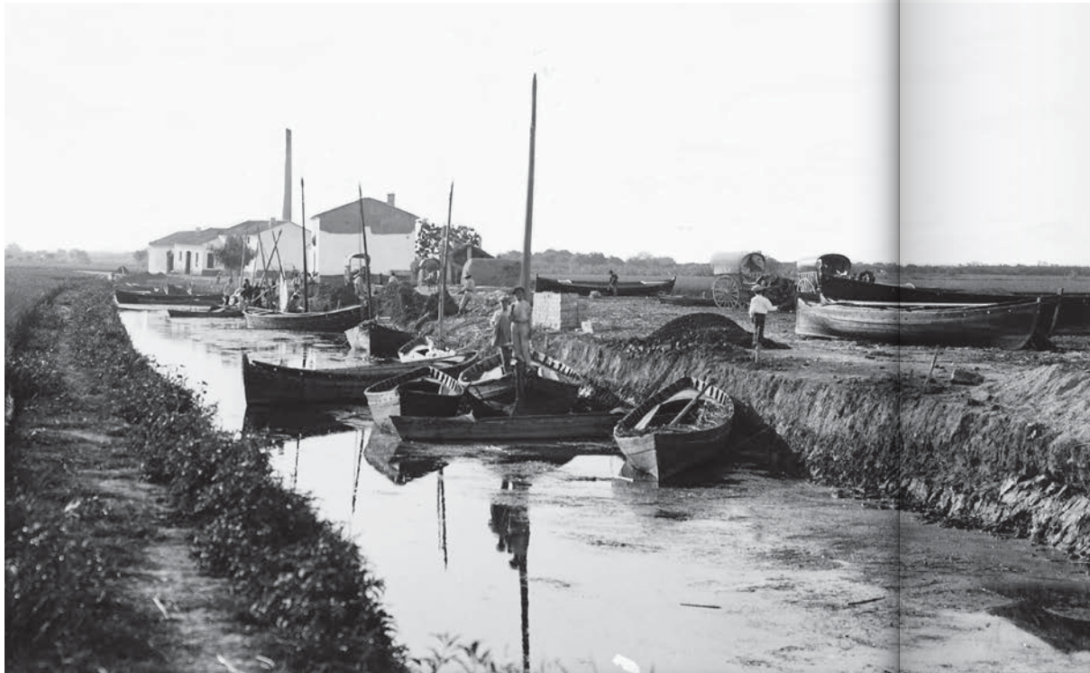
► Puerto de Catarroja