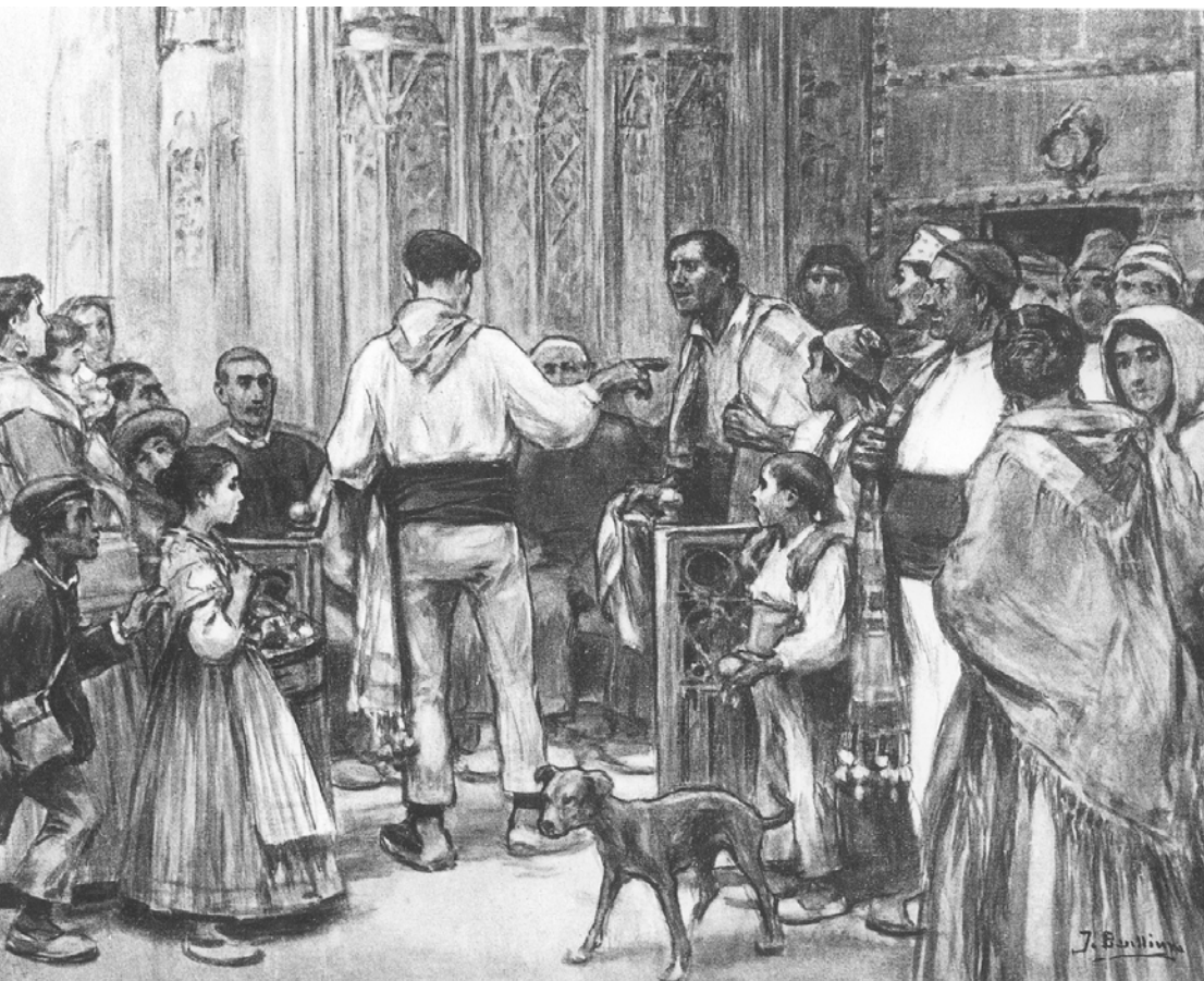
► Ilustración de José Benlliure para la novela La Barraca (1932)

Está previsto que el centro abra sus puertas en el año 2021.