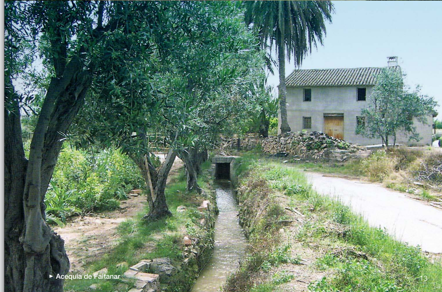
► Acequia de Faitanar