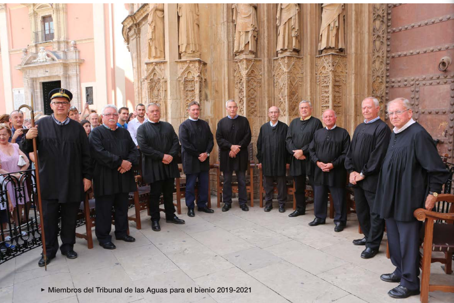
► Miembros del Tribunal de las Aguas para el bienio 2019-2021

Junto al Tribunal de las Aguas de València, la UNESCO declaró también Patrimonio Inmaterial de la Humanidad al Consejo de Hombres Buenos de la Huerta de Murcia. En los dos casos, se trata de tribunales de regantes del Mediterráneo español, y fueron reconocidos el mismo día.