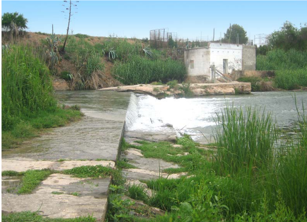
► Azud de Tormos

Las grandes acequias del Turia por su margen derecho son las de Quart, Benácher y Faitanar, Mislata-Chirivella, Favara y Rovella. A ellas se suman otras tres por su margen izquierdo, las de Tormos, Mestalla y Rascaña. En total, el río Turia posee ocho acequias principales.